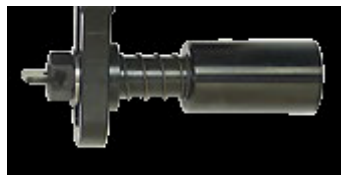
C – Fäste - kort